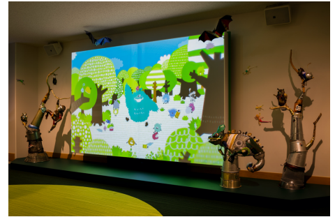
廃材アートを配した絵本シアター

巨大な絵本型のスクリーンと、廃材アートによる展示空間。スクリーンにモフリンと森の仲間たちが現れ、見学へと楽しくナビゲートします。