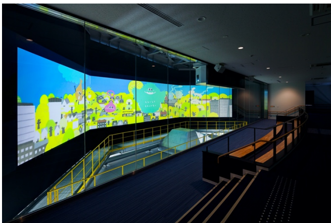
大画面で没入感のある体感映像の「天空シアター」

本施設は、最先端のデジタル映像演出と、廃材アート、ブラックライト等のアナログな空間演出も融合させた、ユニークな展示空間となっています。ごみ処理施設として国内最大級となる、幅約22メートルの大型マルチスクリーンを導入し、ごみ処理の仕組み等を没入感のある体感型映像によって学べる「天空シアター」も設けています。リサイクルの森は、エンターテインメント性のある高品質なコンテンツにより、子供だけでなく大人も楽しみながら体験学習できる先進的な見学施設です。